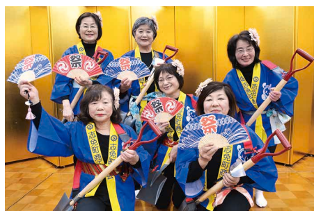
女性部によるスコープ三味線