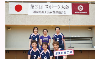
カローリング大会