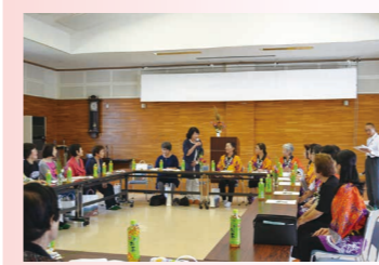
九重町商工会女性部との意見交換会

すでに情報漏えい対策を実行している事業主の方も多いと思われるが、マイナンバーの取扱いは、個人情報保護法よりも厳格な保護措置が設けられています。いま一度、対策の見直しとそれを踏まえた準備をお願いいたします。