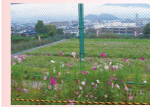
コスモス広場の様子

10月2日(日)に、大分県九重町への視察研修へ行ってきました。今年度は、九重町商工会女性部によるおもてなし交流事業を体験しました。九重町商工会女性部員の皆様によるスコップ三味線の披露など心こもったおもてなしを受けました。交流会では、女性部事業活動の意見交換会をさせていただきました。大変有意義な時間を過ごすことができました。