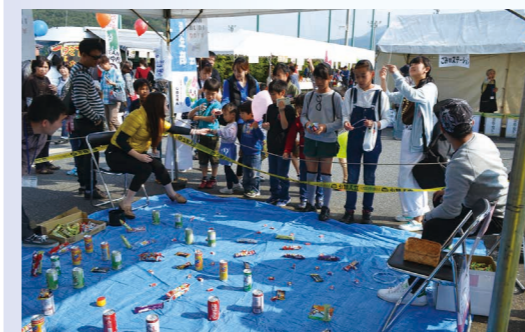
11月6日(日)開催の商まつりでは、子供たちに大人気の綿菓子・かき氷やフライドポテトなどを販売しました。

7月17日(日)、青年部主催レクリエーションを北九州市のスペースワールドにて開催致しました。当日は天候に恵まれ、122名の方にご参加いただき、プールや様々なアトラクションで皆様思い思いの時間を過ごされ、会員やご家族、従業員同士の親睦を深める良い機会になったのではないかと思います。また、普段は自身の事業に勤しんでいる青年部員も、実施内容の検討から当日は引率役として、参加者の皆様楽しく安全に過ごして頂けるよう活動しました。