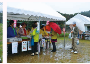
コスモスフェア出店の様子

志免町商工会女性部では、割りばしリサイクル、花いっぱい運動、クリーンアップ活動など、地域の環境改善・景観美化運動にも積極的に取り組んでいます。これからも、地域貢献活動やPR活動など多方面で活躍していきたいと思えます。