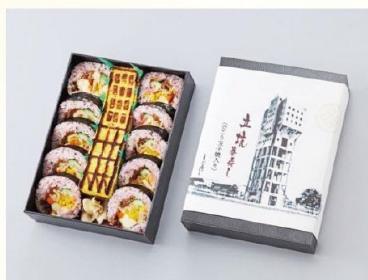
【立坑巻寿司】 創作寿司工房 竜宮城