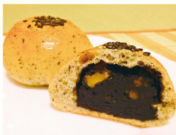
【石炭あんぱん】 ベーカリーアーリーモーニング