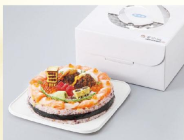
【しめたもん寿司ケーキ】 創作寿司工房 竜宮城