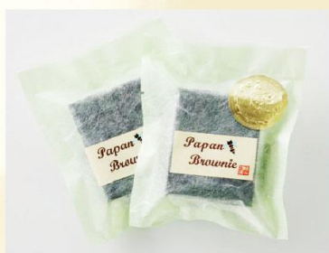
【パパン・ブラウニー】 YUZUKA Patisserie et Cuisine