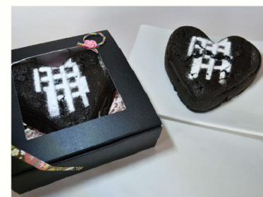
【ガトーノワール(黒いケーキ)】 Nino café