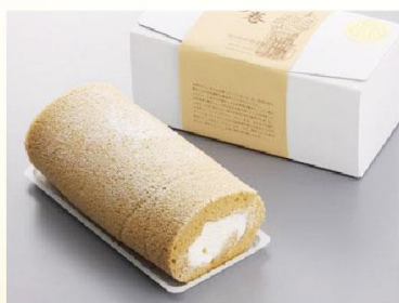
【しめ巻】 Rothen Burg(ローテンブルグ)