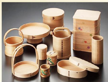
【博多曲物 玉樹】 博多曲物 玉樹