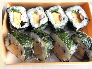
【高菜地産マキ】 寿司割烹 大吉寿司