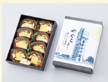
【やぐら寿司】 創作寿司工房 竜宮城