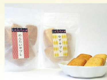
【めんたいサブレ/ゆずサブレ】 柚の木学園 志免せんべい村