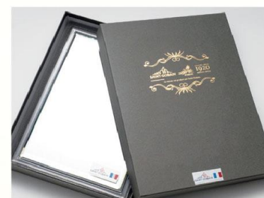
【サンゴパン オリジナルミラー】 株式会社 九鏡