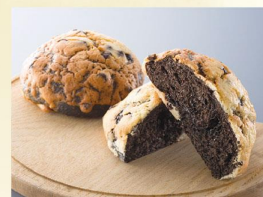
【志免ロン】 小麦工房 パナシェ