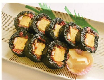
【くろダイヤ巻き】 寿司割烹 大吉寿司