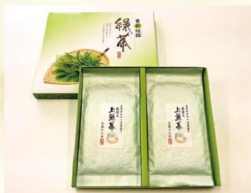
【荒仕上 上煎茶】 お茶の大円