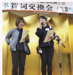
Hospice mind LLC