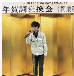
(株)オオサカネーム