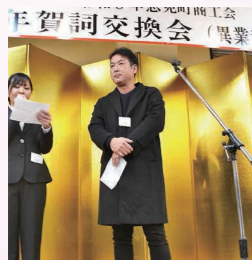
企業紹介(敬称略) なな色訪問看護ステーション